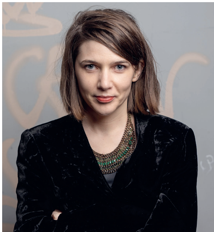
Anaïs Meiers Krimi wird im Neuen Theater Dornach aufgeführt, Foto: Enrico Meyer

«Mit einem Fuss draussen»: Do 21.3. bis Sa 20.4., Neues Theater, Dornach, www.neuestheater.ch © S. 56, www.anaismeier.org